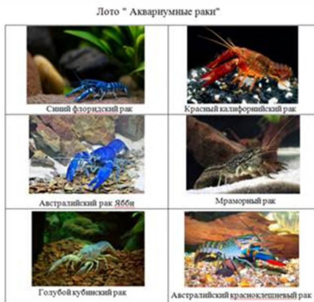
Рисунок 1. Лото «Аквариумные раки»

Задание. Работа с лото «Аквариумные раки» (Рис. 1). Выбрать верный вариант ответа. Проверка. Обсуждение.